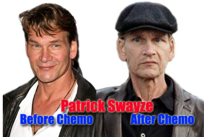
Avant la Chimio - Après la Chimio

La toxicité de la chimiothérapie a été longtemps ignorée par presque tout le monde, de la médecine jusqu'au gouvernement fédéral. Elle a toujours été considérée comme «sûre», juste parce que c'est utilisé comme une sorte de "médicament" pour traiter le cancer. C'est un mensonge. La vérité, c'est que la chimiothérapie est toxique, cancérigène (provoque le cancer), détruit les érythrocytes (globules rouges), dévaste le système immunitaire, et tue les organes vitaux.